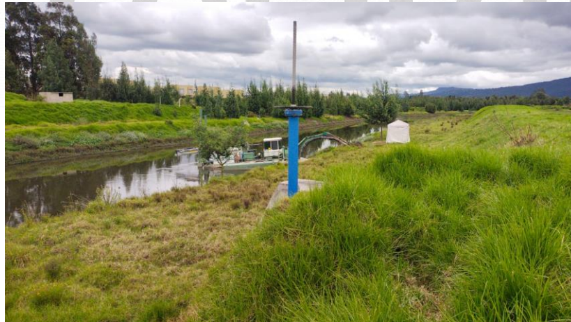
Fotografía 1. Maquinaria para dragado de Contratista en el Río Bogotá

El día jueves 27 de junio se inician nuevamente las labores de reconocimiento e inspección de la red, efectuando la apertura de la válvula mencionada, y se continúa con la inspección por el borde del Río Bogotá, encontrando que se encontraba maquinaria dispuesta adelantando operaciones de limpieza y dragado del río.